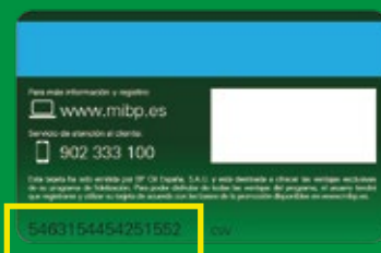
Tarjeta Mi BP